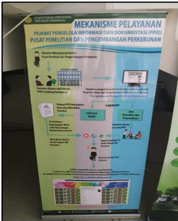
Gambar 1. Banner alur pelayanan PPID PSI Perkebunan

Layanan ini disediakan untuk mempermudah masyarakat luas memperoleh informasi dan mendapatkan rekomendasi di bidang perkebunan, juga mengenai harmonisasi penerapan standar. Dalam layanan ini, pemohon dapat memperoleh informasi terkait harmonisasi, Standar Nasional Indonesia (SNI) Perkebunan, serta pengujian yang tersedia di UPT lingkup Pusat Standardisasi Instrumen Perkebunan. Selain itu, pemohon juga dapat berkonsultasi terkait kerja sama, yang dapat dilakukan oleh Pemda, Universitas, maupun instansi swasta lainnya.