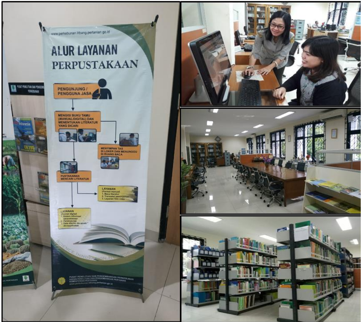
Gambar 4. Banner alur layanan perpustakaan Gambar 5. Pelayanan Petugas Perpustakaan PSI Perkebunan