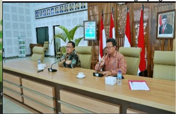
Gambar 3. Konsultasi Pengembangan Komoditas Kopi Disbun Muaraenim dengan Kepala PSI Perkebunan