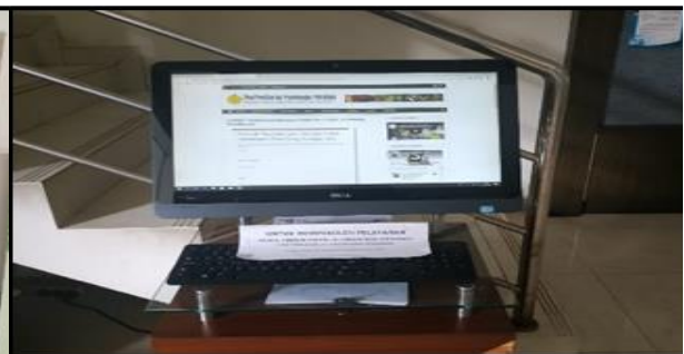
Gambar 2. Monitor Formuler Pengunjung